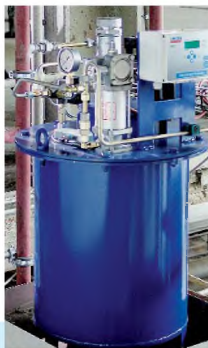
Комплектная насосная станция с системой управления