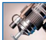
Встроенный держатель для шланговой насадки - надежное сохранение шланга и шланговой насадки