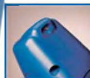
Защитный выключатель двигателя - разъединитель защищает двигатель от перегрузки