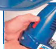
2-режимный выбор мощности - выбор между двумя мощностями при помощи переключателя