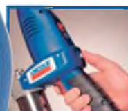
Индикация - контроль общей мощности осуществляется простым нажатием на кнопку