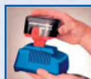
„Интеллектуальное“ устройство заряжает аккумулятор за час - распознает состояние аккумулятора и в выключенном состоянии - сохраняет его в постоянной готовности