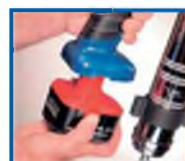
Защелка для легкой замены аккумулятора